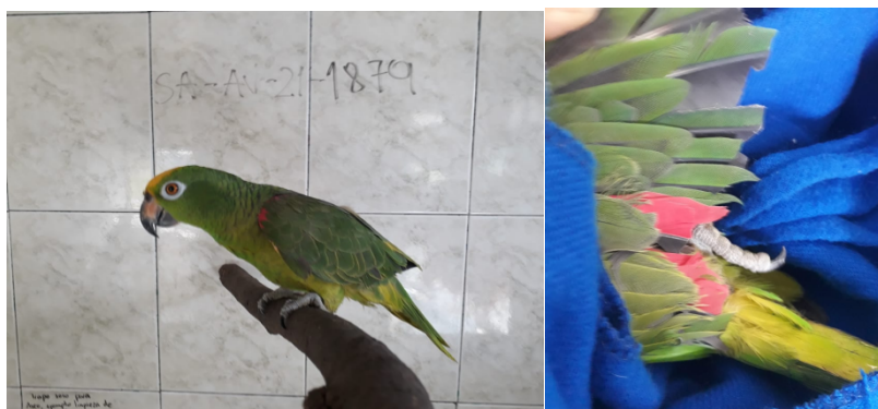
Foto 2. Oficina de Enlace de Secretaría Distrital de Ambiente, procedimiento de un (1) individuo de la especie lora real ( Amazona ochrocephala ). Foto 3. Nótese la mutilación de las plumas de los miembros superiores

Valoración técnica inicial del espécimen: ejemplar vivo, adulto viejo, sexo indeterminado, con vocalización anormal, temperamento agresivo, actitud alerta, presentaba habituamiento, condición corporal 3,5/5, hidratación normal. Presentaba mutilación de plumas bilaterales. Informa que la alimentaba con pan, arepa, maduro y agua. Nunca le hizo tratamiento veterinario. (Foto 3)