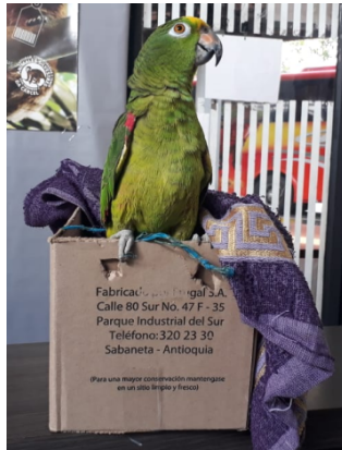
Foto 4. Equipo en el que era transportado el espécimen incautado AI 161283